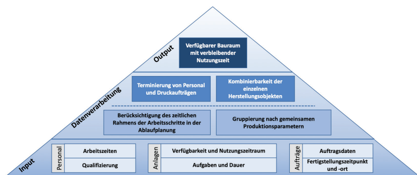
Bild 1: Identifizierung von ungenutzten Fertigungskapazitäten additiver Fertigungsanlagen.